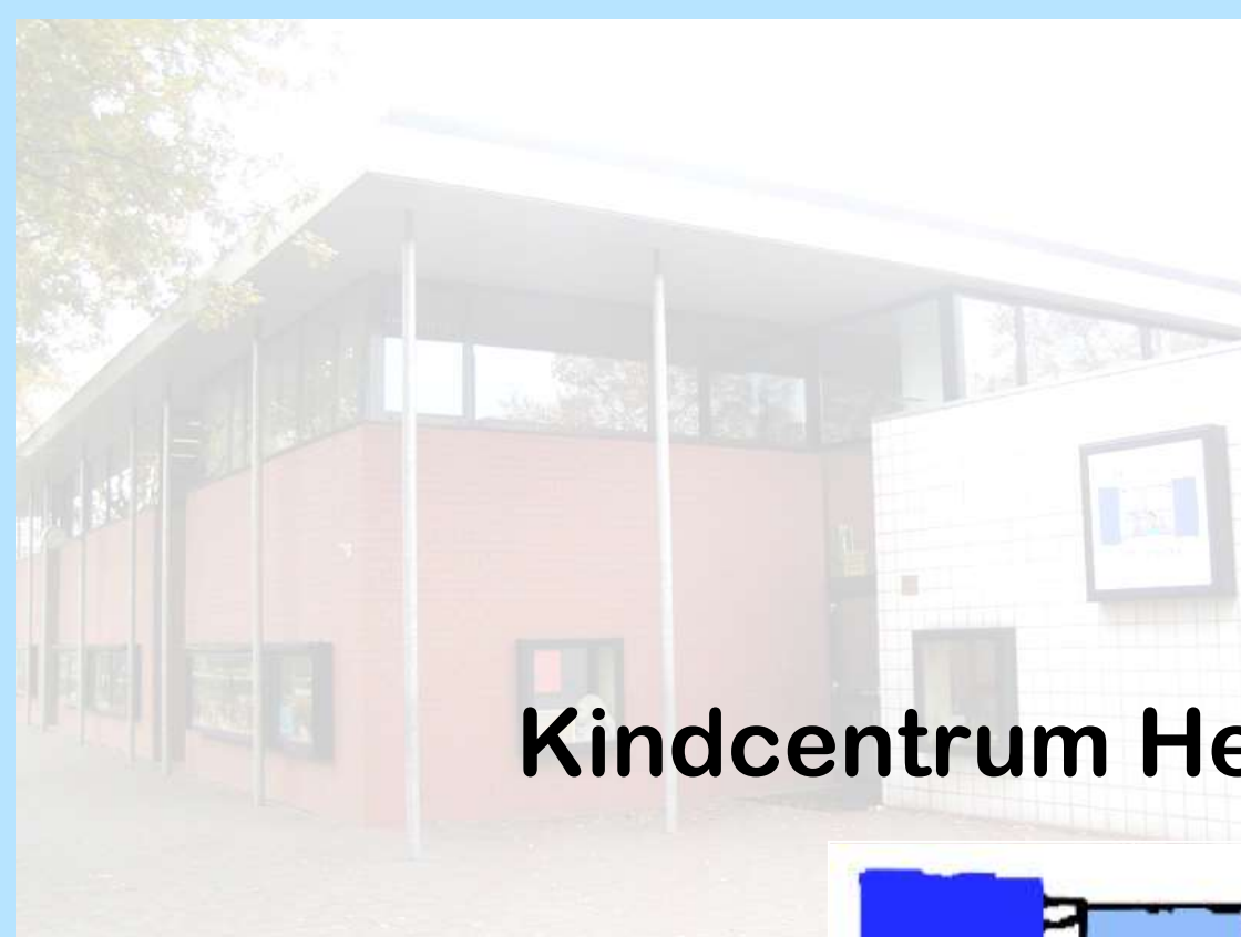
Kindcentrum Het Venster